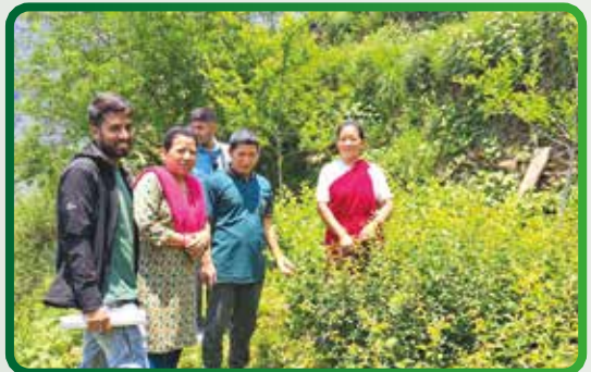
फिल्ड अनुगमन तथा निरिक्षण