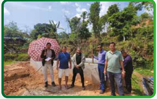
फिल्ड अनुगमन तथा निरिक्षण