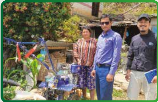
कृषि यन्त्र वितरण कार्यक्रम