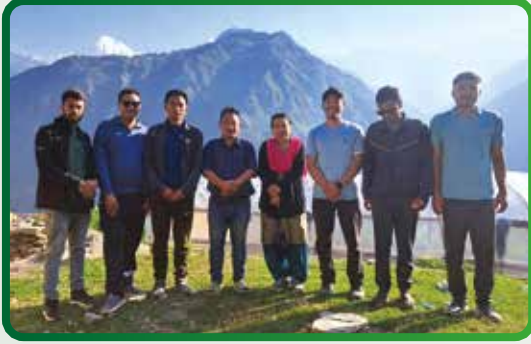
फिल्ड अनुगमन तथा निरिक्षण