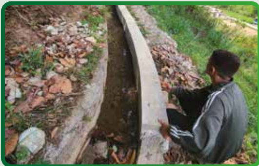
साना सिँचाई निर्माण कार्यक्रम