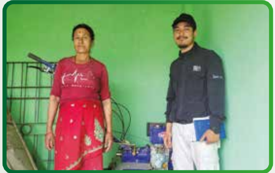
कृषि यन्त्र वितरण कार्यक्रम